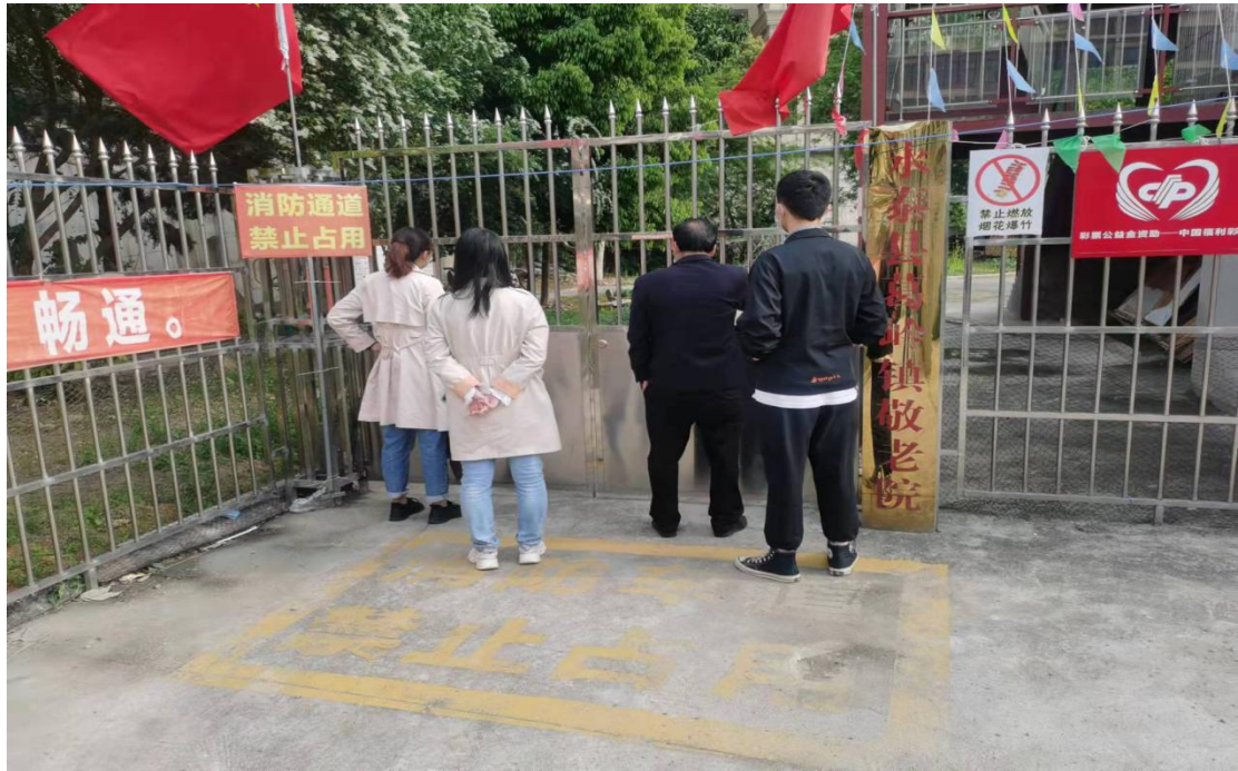
▲ 检查葛岭镇疫情防控工作情况