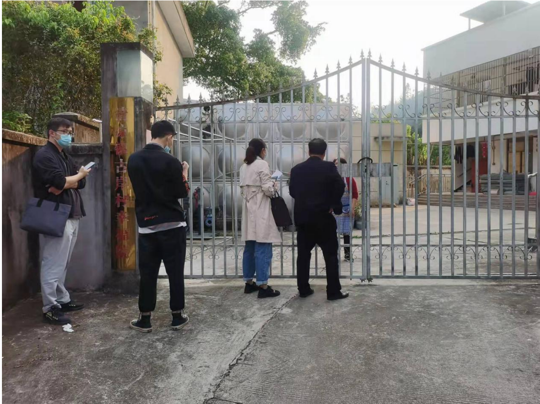
▲ 检查清凉镇疫情防控工作情况