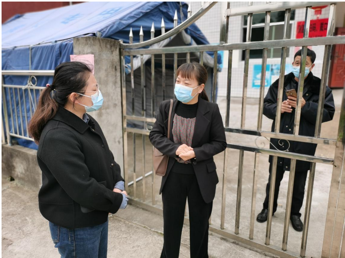
▲ 检查白云乡敬老院疫情防控工作情况