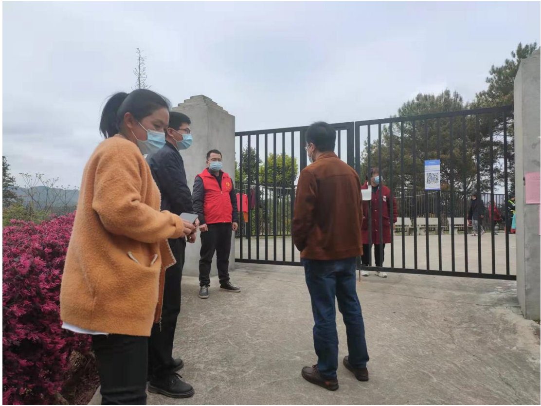
▲ 检查大洋镇敬老院疫情防控工作情况