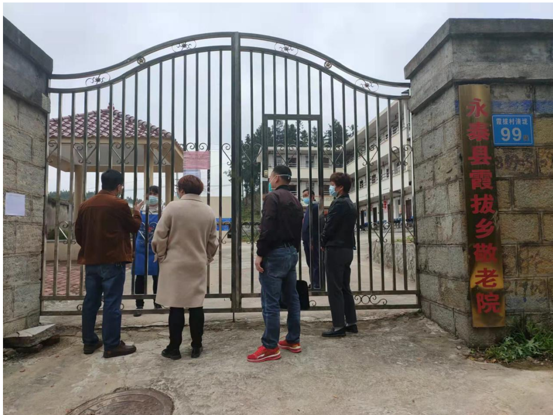
▲ 检查霞拔乡敬老院疫情防控工作情况