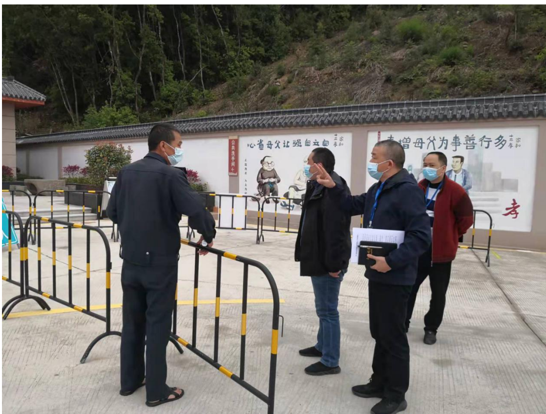
▲ 殡葬管理所检查县殡仪馆疫情防控工作情况

截至 2022 年 3 月 24 日，永泰县民政局共派出督导组 105 人次，深入永泰县社会福利中心（金太阳老年公寓）、永泰县殡仪馆、永泰县天境陵园、清凉镇敬老院等民政服务机构共 14 个，现场详细了解民政服务机构落实封闭管理、民政工作人员和服务对象健康监测以及场所消杀、通风换气、防疫物资储备等情况，对发现的问题要求即知即改，对未能当场整改的问题提出具体整改措施，明确整改时限，并实时动态跟踪，切实补齐防疫短板，全面堵塞漏洞，做到不留盲区、不留隐患。