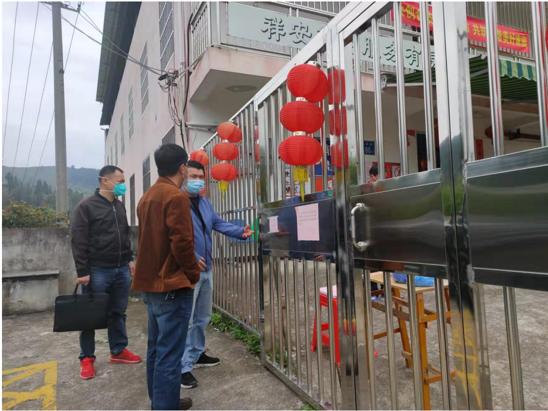
▲ 检查东洋乡敬老院疫情防控工作情况