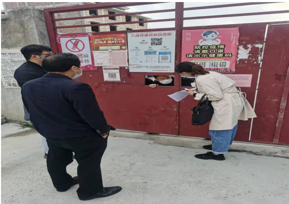
▲ 检查城峰镇疫情防控工作情况