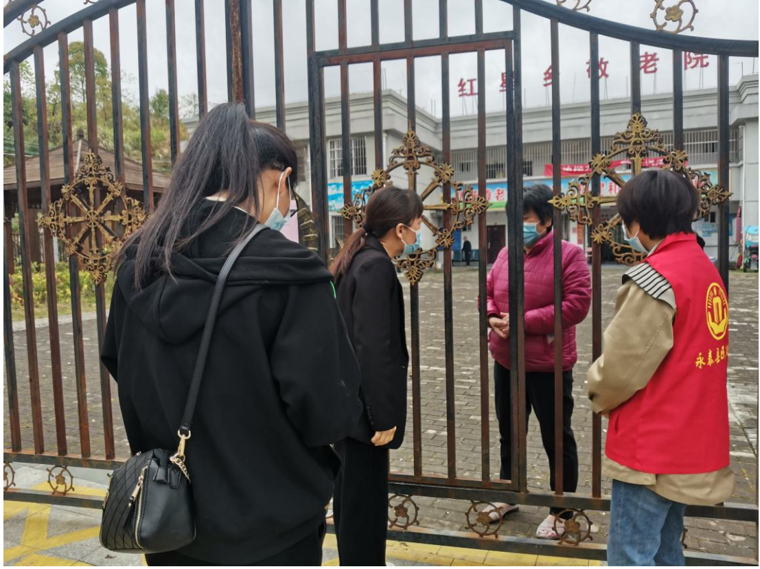
▲ 检查红星乡敬老院疫情防控工作情况