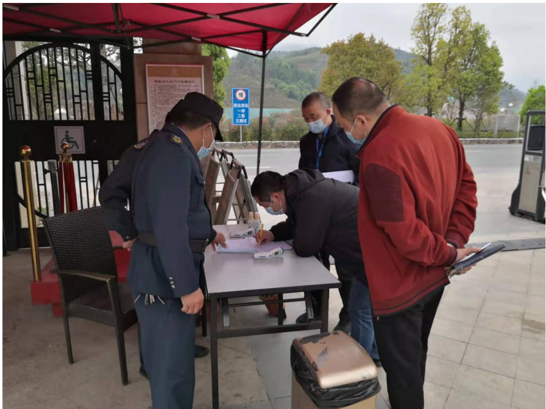
▲ 检查天境陵园疫情防控工作情况