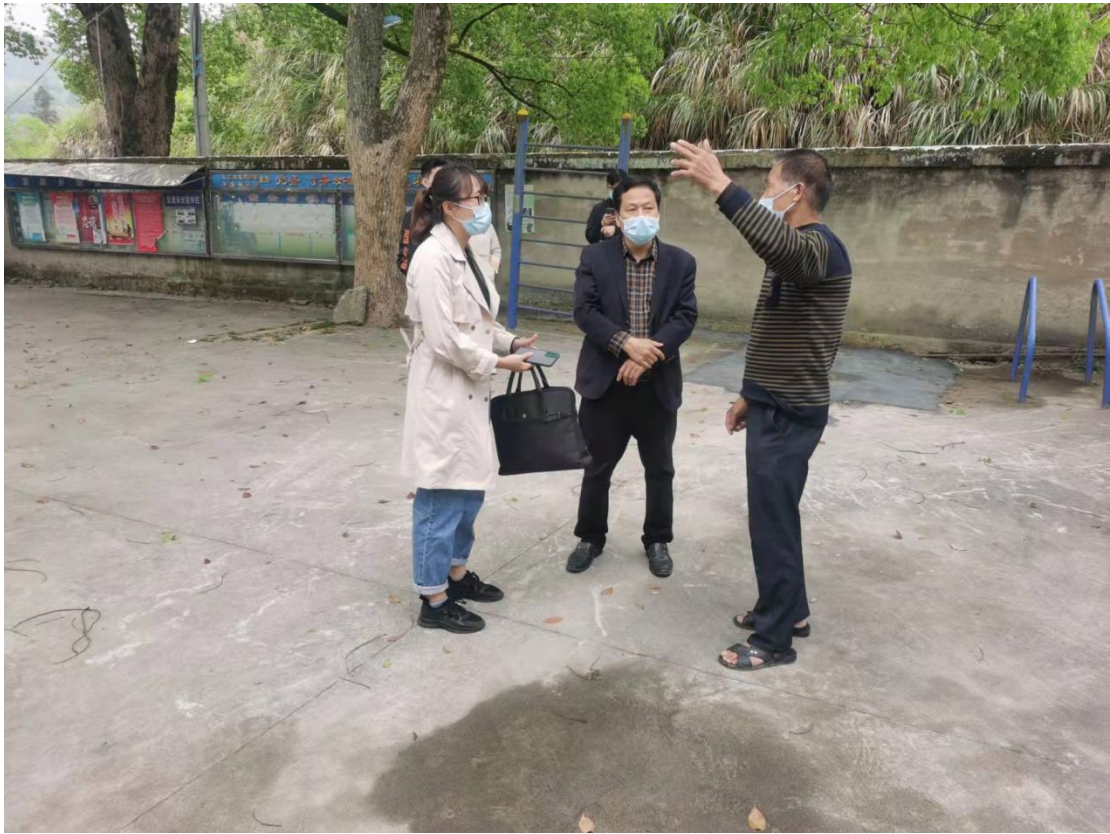
▲ 检查富泉乡敬老院疫情防控工作情况