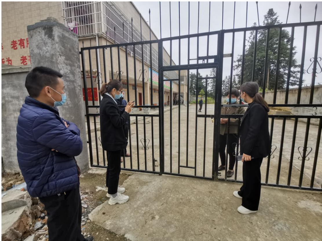
▲ 检查盘谷乡敬老院疫情防控工作情况